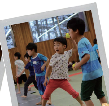
いろは教室では、MIZUNO社製の「エリブスセンス」というボールも使って遊びます。