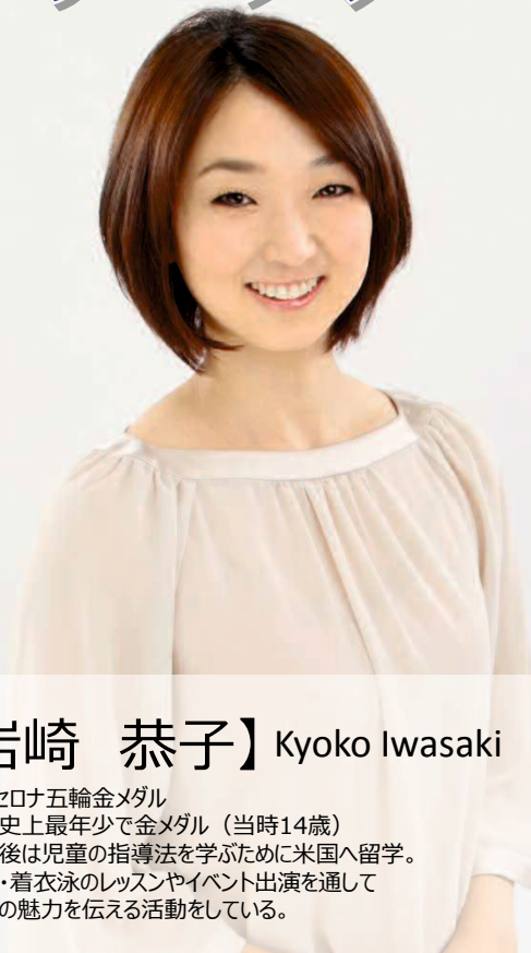
【岩崎 恭子】Kyoko Iwasaki

バルセロナ五輪金メダル 競泳史上最年少で金メダル（当時14歳） 引退後は児童の指導法を学ぶために米国へ留学。 水泳・着衣泳のレッスンやイベント出演を通して 水泳の魅力を伝える活動をしている。