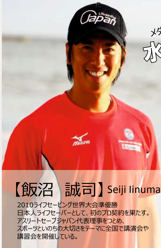
【飯沼 誠司】Seiji Iinuma

バルセロナ五輪金メダル 競泳史上最年少で金メダル（当時14歳） 引退後は児童の指導法を学ぶために米国へ留学。 水泳・着衣泳のレッスンやイベント出演を通して 水泳の魅力を伝える活動をしている。