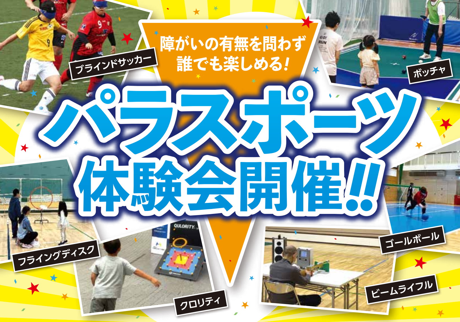
ブラインドサッカー