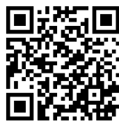
新型コロナウイルス感染症対策について