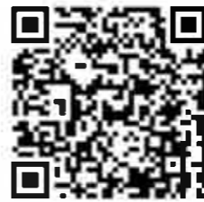
プライバシーポリシー

◆1 3ヶ月~2歳児のお子様とその保護者1名 従来の時間から変更となっておりますので、確認のうえお申込みください。