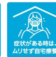
症状がある時は、 ムリせず自宅療養