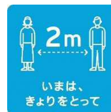
いまは、 きよりとって