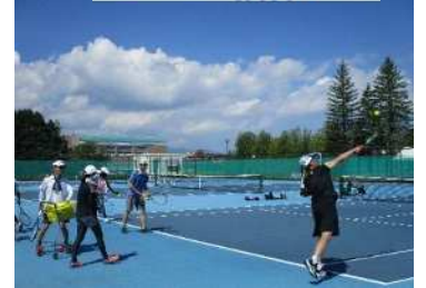
※写真は別教室です。

北海道から世界へ翔ける選手の育成、北海道テニスの普及、活性化に貢献したいと考えています。