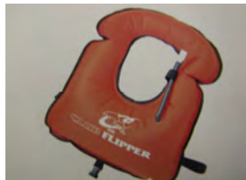
ライフジャケット