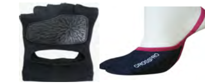
アクアラン・水中W用ソックス