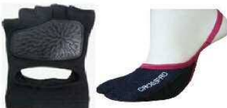
【アクアラン・水中 W 用ソックス】