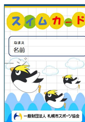
「スイムカード」 厚別温水プールは R6年度から