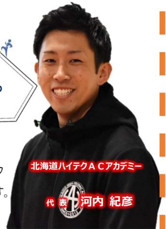
北海道ハイテクACアカデミー